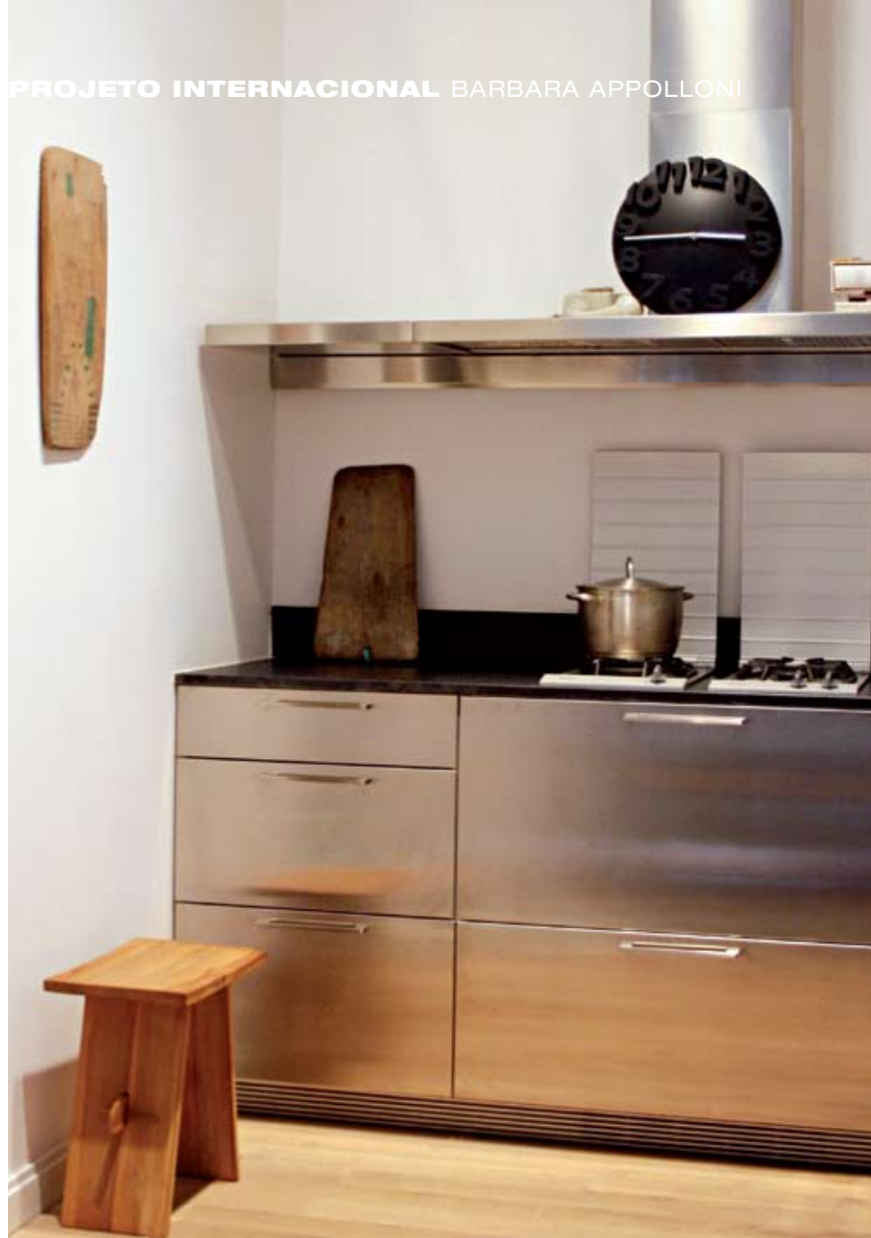
À esquerda, a cozinha em aço inox dá ares industriais ao apartamento. Abaixo, detalhe do corredor pop. À direita, o prático home office, com diferentes texturas na ambientação